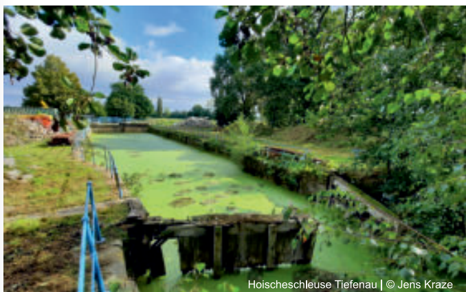
Hoischeschleuse Tiefenau

Durchqueren Sie auf dieser Wanderung den Röderauwald und bestaunen Sie uralte majestätische Bäume, die Naturdenkmäler der Röderau.