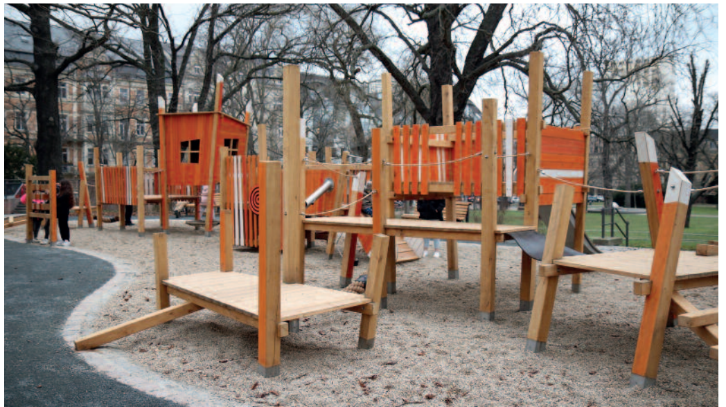
Die runderneuerte Anlage am Alexander-Puschkin-Platz bietet jede Menge Klettervarianten.

Der rundum erneuerte Spielplatz an der Südseite des Alexander-Puschkin-Platzes konnte am vorigen Freitag für alle bewegungsfreudigen Kinder freigegeben werden. In den vergangenen Monaten war die Anlage durch ein Meißner Bauunternehmen zu großen Teilen neugestaltet worden. Die Resonanz ist nach erstem Augenschein durchaus positiv und ziemlich viel „Betrieb“. Die farbenfrohe neue Kletterkombination bietet mit vielen Treppen, Seilen, Balancierbalken sowie einer Rutsche und einer Nestschaukel