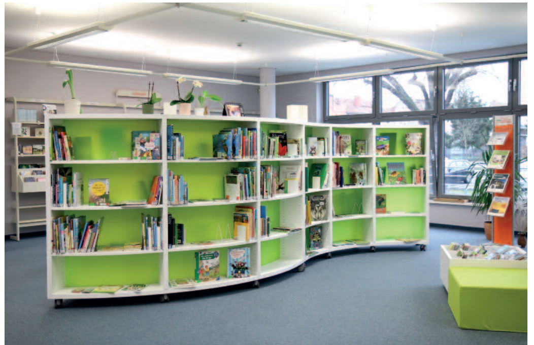
Die Stadtbibliothek ist Treffpunkt für alle Generationen, für alle Literaturinteressen von Klassik bis Krimi, für Film- und Musikfans. Im Jahr 2023 hofft man wieder auf steigende Ausleihzahlen.

B ibliotheken haben über die mehr als zwei Jahre mit mehr oder weniger strengen Einschränkungen wegen der Covid-Pandemie sehr widersprüchliche Erfahrungen gemacht. Einerseits verlockte die unfreiwillige Bindung an Haus und Hof dazu, öfter wieder zum Buch zu greifen – andererseits war die Arbeit der Einrichtungen erheblich erschwert. Das angeregte Stöbern zwischen den Regalen war monatelang nicht möglich, es fehlte der direkte Kontakt zwischen Bibliothekarin und Leser, hilfreicher Rat konnte nur indirekt gegeben werden. Doch die Riesaer Stadt- und Kinderbibliothek im Haus am Poppitzer Platz hat vor allem dank des großen Engagements ihrer literaturbegeisterten Mitarbeiterinnen das Beste aus diesen Widrigkeiten gemacht. Und die allmähliche Rückkehr zum Normalbetrieb ist im Vorjahr im Großen und