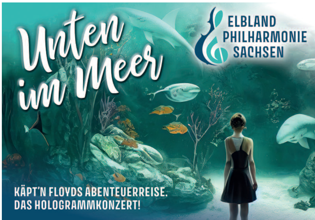
Klassik trifft virtuelle Welt: Beim Konzert für die ganze Familie geht es auch um die Elbe.

Eintrittskarten gibt es bei der Elbland Philharmonie Sachsen (Tel. 03525 72260), online unter hallo.etix.com/eps sowie an der Tages- bzw. Abendkasse. Für das Vormittagskonzert sind Sondertickets für Schüler zum Preis von fünf Euro erhältlich. Info: EPS