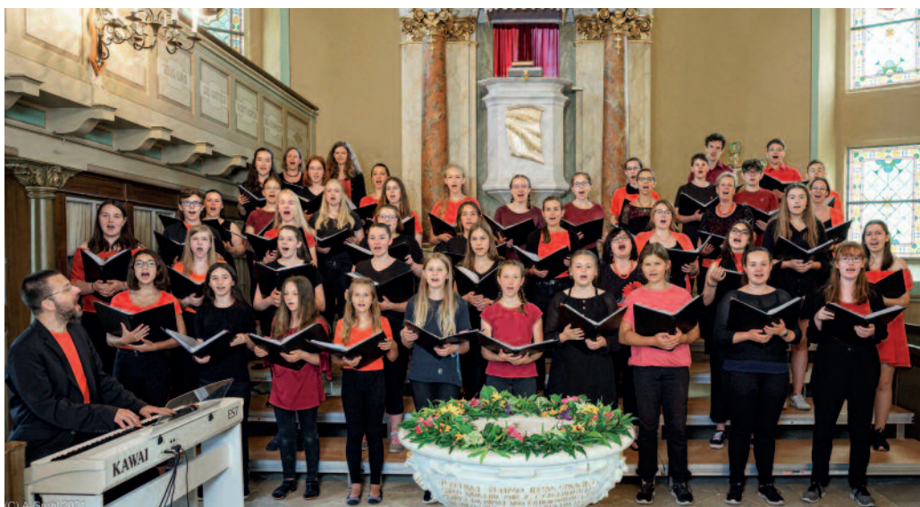
Jugendliche Stimmen laden am 8. März zum Konzert in die Trinitatiskirche ein.

Diejenigen Frauen, die am 8. März einfach mal „die Seele baumeln“ lassen und sich ausruhen wollen, könnte das Frauentags-Special in der Damensauna des Riesaer Hallenschwimmbades interessieren: Von 9 bis 21 Uhr gibt es dort spezielle Aufgüsse, Wissenswertes rund um ätherische Öle und allerlei Wohlfühl-Behandlungen. – Eine Aufzählung, die sich beliebig fortsetzen ließe.