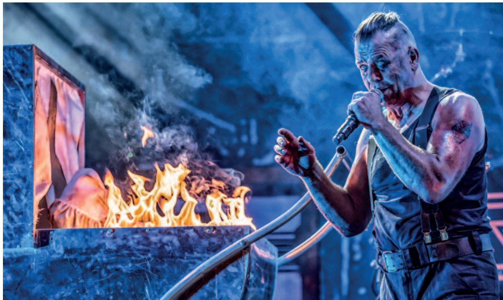
Schweiß, Feuer und jede Menge Energie: STAHLZEIT kommt am 11. März nach Riesa.

STAHLZEIT leben im Takt des musikalischen Brachial-Herzschlags und im unstillbaren Drang, auf der Bühne neue Dimensionen zu kreieren, die mit den Grenzen des Vorstellbaren kokettieren. Die Pyroshow wird so kompromisslos und spektakulär umgesetzt, dass man die Hitze bis zu den entferntesten Plätzen spüren kann. Schweiß, Feuer und die einzigartige Energie fahren den Besuchern während der rund zweieinhalbstündigen Show in Mark und Bein. Der