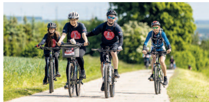
Energie-Radler sind diesmal im Elbland unterwegs.

Die SachsenEnergie AG lädt am Sonntag, 4. Juni, zur 21. Erlebnisradtour für Freizeitradler ein. Diesmal ist sie im Elbland zu Gast. Die Anmeldung ist bis 29. Mai auf www.rundumtour.de möglich. Der Start erfolgt zwischen 9 und 11 Uhr an der Mehrzweckhalle Röderau. Von dort geht es nach Zeithain, Streumen und Glaubitz, über die Elbe nach Riesa und wieder zum Ausgangspunkt zurück, insgesamt 45 Kilometer. Unterwegs gibt es u. a. den Windpark Streumen, das Nudelmuseum sowie das Kloster und das Rathaus Riesa zu erkunden.