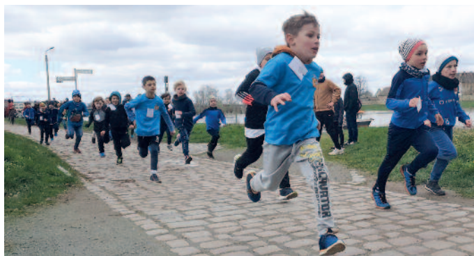
Mit großem Ehrgeiz ging es entlang der Elbe zur Sache.