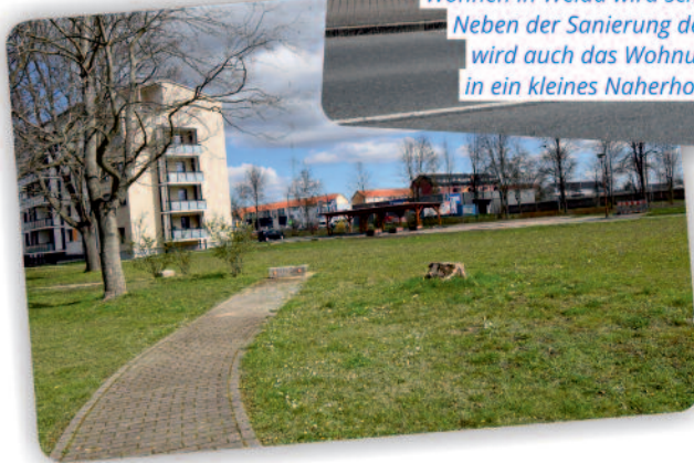
Wohnen in Weida wird schon bald noch angenehmer: Neben der Sanierung der Dresdner Straße 25-31 wird auch das Wohnumfeld aufgewertet und in ein kleines Naherholungsgebiet verwandelt.

Trotz vieler noch ungeklärter Fragestellungen über das WIE und WOMIT sind die Mitarbeiterinnen und Mitarbeiter der Wohnungsgesellschaft derzeit alles