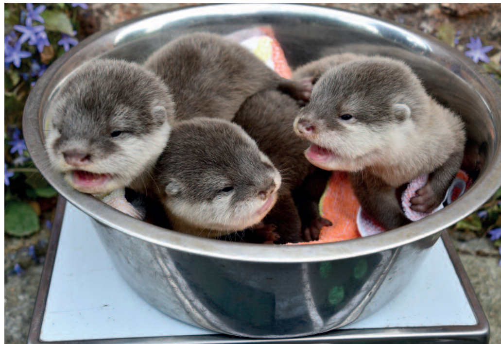
Ganz geheimer schien den drei Knirpsen die Schüssel nicht zu sein, aber die Waage zeigt, dass sie sich in den ersten Lebenswochen sehr gut entwickelt haben.

Auch wenn sich die Kleinen nun immer öfter auf Erkundungstour durchs Gehege begeben, fehlt ihnen noch eine wichtige Fähigkeit, die jeder Otter in Perfektion beherrscht: das Schwimmen und Tauchen, denn angeboten ist diese Fertigkeit nicht.