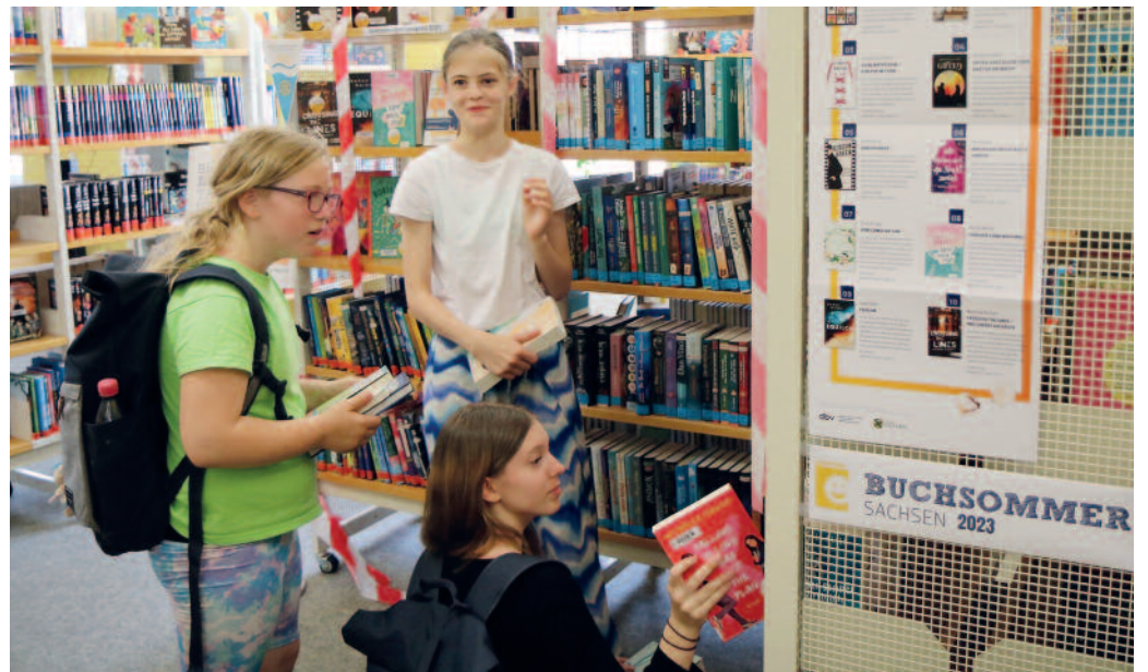
Vorfreude aufs Lesevergnügen: Der Buchsommer ist für viele ein fester Bestandteil der Ferien.

In der letzten Schulwoche vor den Ferien startete die Aktion, die bis 25. August läuft. Ob man die Bücher auch wirklich gelesen hat, muss vor einer Jury nachgewiesen werden, die stichprobenartig den Inhalt abfragt. 88 Anmeldungen für den Buchsommer und 56 für