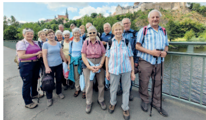
Die „kleine“ Gruppe an der Mulde vor Leisnig.

Die Juniwanderung stand für 59 Wanderfreunde des SC Riesa unter dem Motto „Landschaft und Geschichte“. Von Technitz über Westewitz und Klosterbuch nach Leisnig verlief der Weg rechts der Freiburger Mulde. Sie ist mit ihren 124 Kilometern Länge der rechte Quellfluss der Mulde. Der Wanderweg deckte sich oft mit dem Mulderadweg, ist als Riedelsteig bekannt und angenehm zu laufen. Das ehemalige Zisterzienserkloster Buch wurde 1192 gegründet und bis zur Reformation klerikal genutzt; danach wurde die Anlage landwirtschaftlich betrieben. Kurz vorm Ziel erfreute