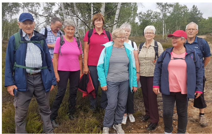
Die Mittelgruppe in der Heide.