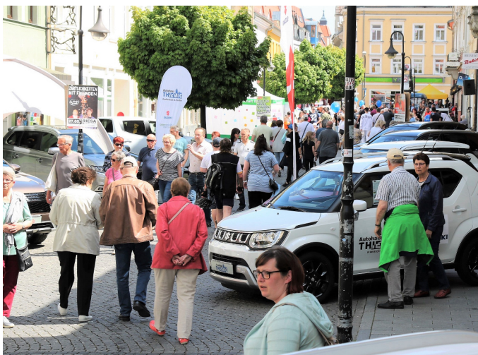
Zu Festen wie hier zur Automeile 2022 ist die Innenstadt voller Menschen. Für den Alltag braucht es aber auch neue Ideen.

möchte, kann sich an das Kontaktbüro Innenstadt, Hauptstraße 37, wenden. Es ist unter Tel. 03525 6570 338 oder per Mail innenstadt@stadt-riesa.de zu erreichen. Die Fragen betreffen das Riesaer Fördergebiet des Bundesprogramms „Zukunftsfähige Innenstädte und Zentren“ (ZIZ) als Teil des umfangreicheren Förderprogramms „Lebendige Zentren“ (LZP) in der Innenstadt. Dazu gehört die 1,5 km lange Fußgängerzone, die durchgehend von circa 240 Ladengeschäften gesäumt ist, die derzeit aber auch mit einer relativ hohen Leerstandsquote konfrontiert ist. U.P.