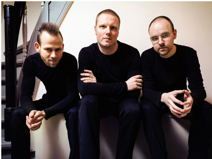
Musikalische Innenschau mit rockigem Drive.

Das Konzert beginnt 19.15 Uhr, der Einlass erfolgt ab 18.15 Uhr, so dass man sich vorher im Tierpark umschaun kann. Eintrittskarten gibt es in der RIESA Information, im DDV-Lokal und in allen bekannten Vorverkaufsstellen. Zudem können Tickets unter www.wt-arena.de bestellt werden. Kartentelefon und Informationen unter der Nummer: 03525 529422. FVG