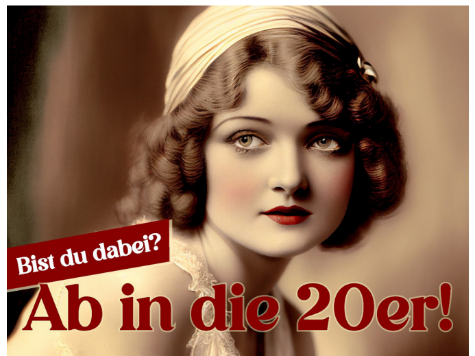
Die junge Frau der 1920er ist fiktiv und mit künstlicher Intelligenz erstellt, aber man kann gern im Stil der Zeit der Museumsgründung erscheinen.