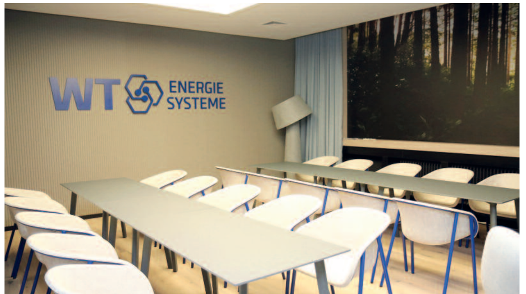
Diese Plätze werden nicht lange leer bleiben: Mit der WT-Loge ist der so genannte Hospitality-Bereich neben Feralpi-Loge und Weinlounge nun komplett.

Außerdem hat der neue Premiumpartner eine Loge in der Arena gemietet. Deren Umbau im typischen Design der WT