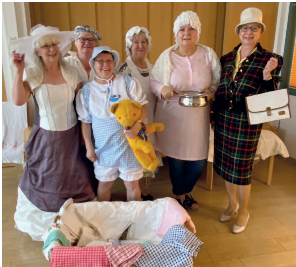
Mitarbeiterinnen des Hauses hatten sich für eine lustige Modenschau herausgeputzt und sorgten bei den Bewohnerinnen und Bewohnern für viel Spaß.