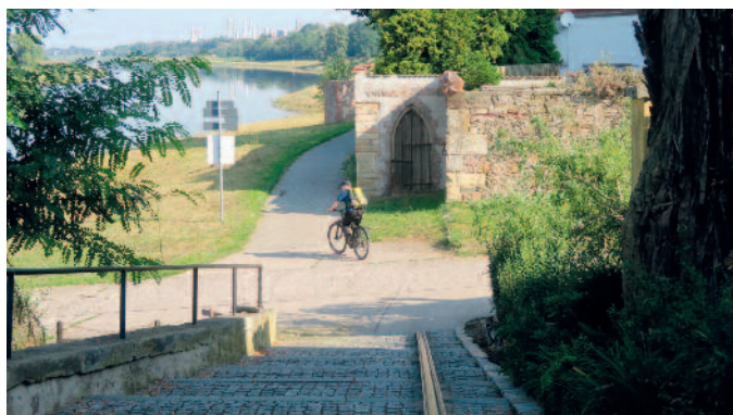
Malerisch: Die alte Handelsstraße Via Regia bei Merschwitz.