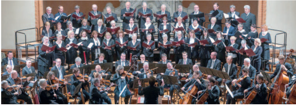
Offen für neue Mitsängerinnen und Mitsänger: Die Riesaer Kantorei – hier bei einem Mendelssohn-Konzert mit der Elbland Philharmonie. Am kommenden Dienstag ist „Schnupper-Probe“.

Die Kantorei Riesa lädt für Dienstag, den 12. September von 19.30 Uhr bis 21 Uhr im Rahmen der bundesweit stattfindenden „Woche der offenen Chöre“ des Deutschen Chorverbands zu einer Schnupperprobe ein. Mit dieser Aktion soll neuen Mitsängerinnen und -sängern die Gelegenheit geboten werden, unkompliziert musikalischen Kontakt zu knüpfen. Die Kantorei Riesa studiert gerade das „Requiem“ von Wolfgang Amadeus Mozart ein, das am 18.11. 2023 in der Trinitatiskirche zur Aufführung kommen wird. Bei der Probe am 12.9. gibt es die Möglichkeit, einmal