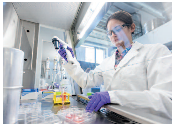
Biotechnologie ist ein zukunftsfähige Studienrichtung, die an der Riesaer Studienakademie gelehrt wird.