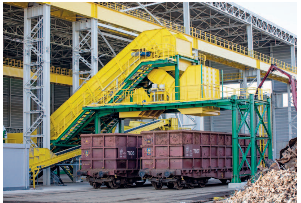
Die neue Schrottaufbereitung des Riesaer Stahlwerks.

Knapp 20 Millionen Euro und zwei Jahre Zeit stecken in Phase eins der Schrottaufbereitung am Standort Riesa. Mit der Einweihung am 15. Sep-