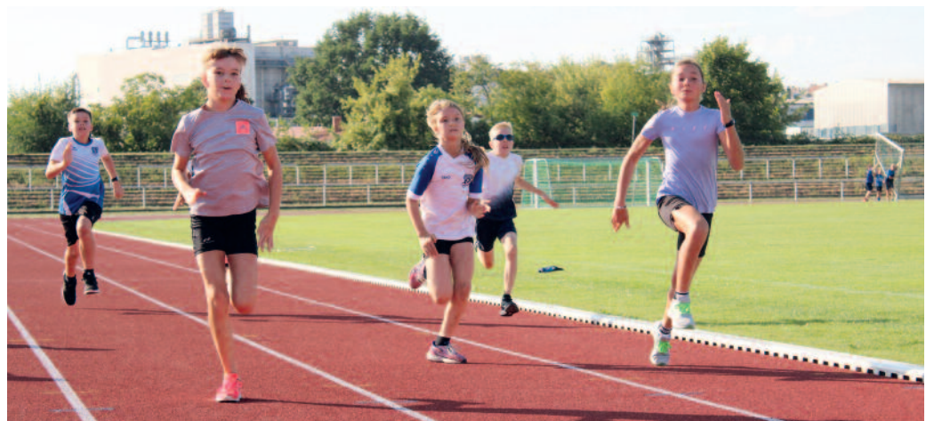
Leichtathletik bietet Spaß in der Gemeinschaft, aber jeder kann sich auch individuell beweisen.

Sprint, Sprung und Wurf gesucht werden. Unter der Mail LAtainer@sc-riesa.de werden den Eltern bei Angabe des Geburtsjahres ihres Kindes alle Anfragen gern beantwortet. Die Rückmeldung mit einer ersten Terminabstimmung erfolgt dann gleich mit den jeweiligen Trainern. K.R.