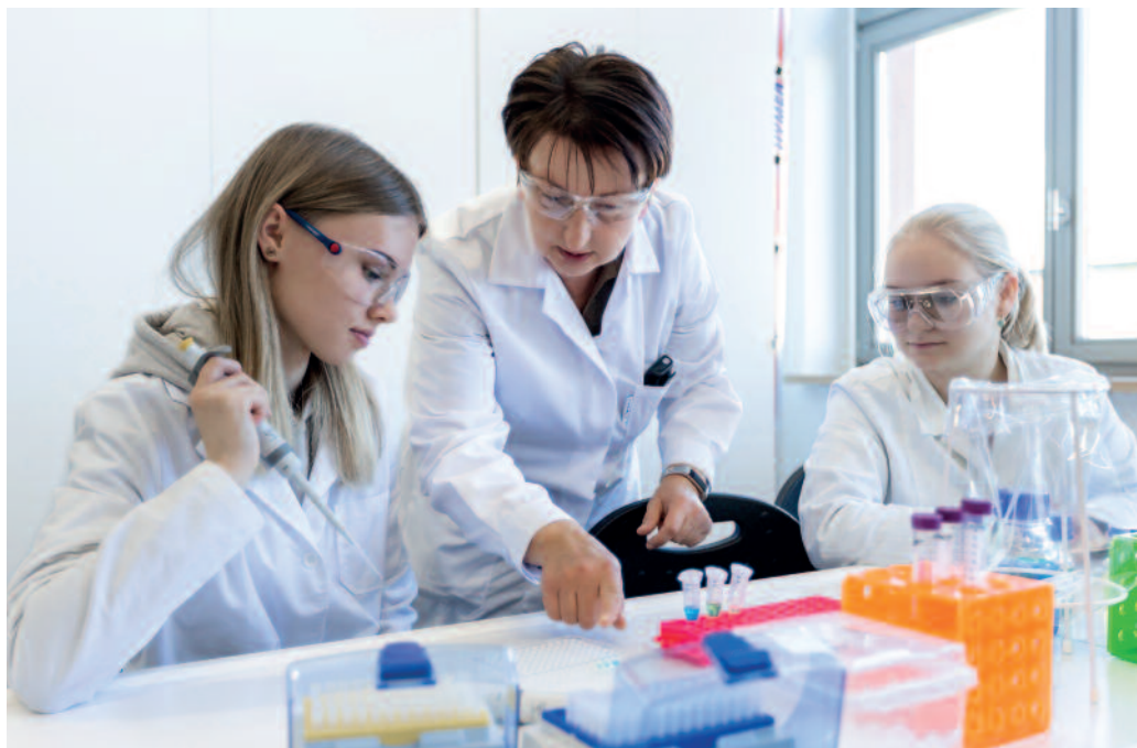
Hochschulabschluss in nur drei Jahren – ab 2025 auf dem Campus möglich.