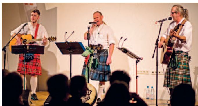
Mit „Leprechaun's Pleasure“ wird es irisch im Kino.

zung sowie einer Sonderausstellung, einem Geschichtsvortrag und einem „Kaffeeplatsch“ im Stadtmuseum. Die nächsten 150 Jahre möchte die Wehr dann mit der neuen Feuerwache beginnen, deren Bau im Herbst beginnen und 2026 fertig sein soll. Was bis dahin an Bränden, Fluten oder Stürmen kommt, ist natürlich nicht absehbar – aber Riesas Feuerwehrleute werden vorbereitet sein. U. Päsler