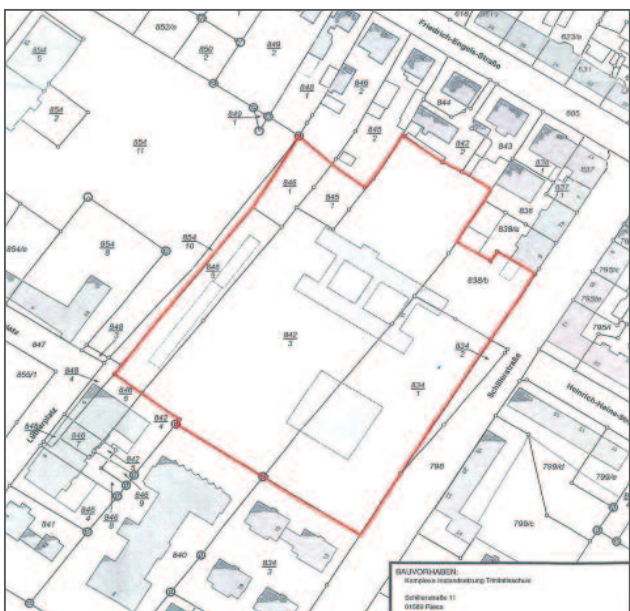
Auszug aus dem Liegenschaftskataster mit roter Kennzeichnung des betroffenen Baugrundstückes und Angabe der angrenzenden Flurstücke/Grundstücke einschließlich der Flurstücksnummern.

Die vollständige Baugenehmigung und die Verfahrensakte können durch die betroffenen Nachbarn in den Räumen der Unteren Bauaufsicht der Stadt Riesa, Rathausplatz 1, 01589 Riesa, mit vorheriger telefonischer Terminabsprache unter der Nr. 03525 700-296 eingesehen werden.