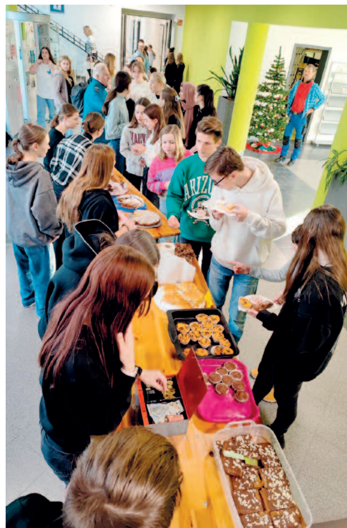
Schmackhaft für den guten Zweck: Mit Selbstgebackenem sammeln die Schüler Geld für das Kinderhospiz.

Schüler der 9. Klasse der Oberschule „Am Merzdorfer Park“