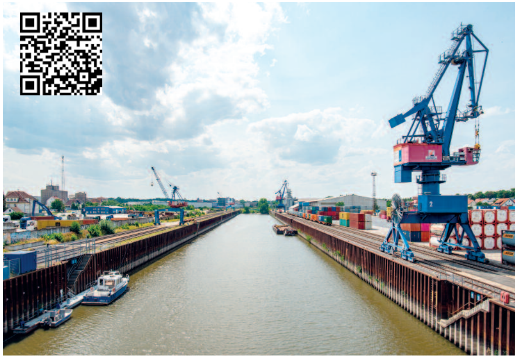
Auch im Hafen in Gröba lässt sich Interessantes entdecken.