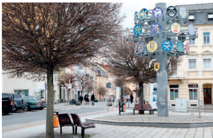
Fahrradständer am Zunftbaum und „blumige Verschönerung“ der Hauptstraße sind zwei der ausgewählten Vorschläge.

Auch die Ortsteile gehören stets dazu, wenn es um ein schöneres Lebensumfeld geht. So werden 1.000 Euro Zuschuss für die Sanierung eines Zaunes am Leutowitzer Dorfteich fließen. An einer Brücke des Jahnatalweges zwischen Oelsitz und Pausitz soll baulich der Höhenunterschied beseitigt werden. Hier wird die Stadt jedoch noch prüfen, ob dafür auch Fördermittel akquiriert werden können. Und weil nicht nur Bauliches, sondern auch gemeinsame Erlebnisse zum guten Miteinander gehören, wird ein in Nickritz geplantes „Seifenkisten-Rennen“ mit 500 Euro bezuschusst.