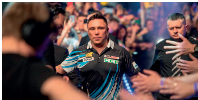
Auch Gerwyn Price soll in Riesa wieder dabei sein.