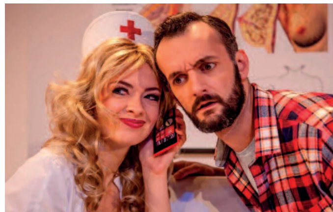
So züchtig geht es nicht immer zu.

Und dann sind da ja noch die Patienten! Wer ist beispielsweise das schüchterne Fräulein