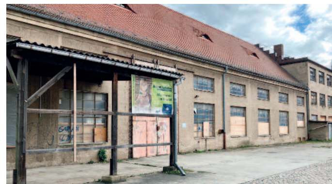
Im einstigen Rittergut Gröba wird geforscht und getüftelt.

Ab 13.30 Uhr folgen in der Offenen Werkstatt, Lange Straße 51c, Vorträge und Fachgespräche zwischen Vertretern der Forschung und Wissenschaft sowie Anwendern zu Möglichkeiten der energetischen Ertüchtigung historischer Objekte und technischer Anwendungen am Denkmal. Programm und Anmeldeformular sind unter www.denkmalnetz-sachsen.de und https://inno-handwerk.de zu finden. Denkmalnetzwerk