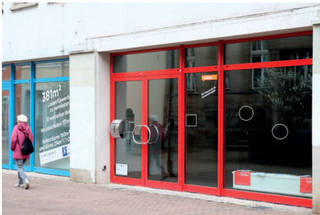
In einem leerstehenden Geschäft auf der Hauptstraße hat jetzt der D.ORT sein Domizil.

Künftig wird der Raum regelmäßig mittwochs von 13 bis 16 Uhr und freitags von 10 bis 13 Uhr für die Öffentlichkeit zugänglich sein. Zunächst wird dort eine Ausstellung aus der Verantwortungswoche des Städtischen Gymnasiums zum Thema „Welche Themen bewegen mich in Riesa?“ präsentiert. Die Jugendlichen können dabei ihre Sichtweise auf