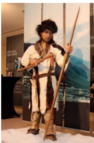
Ötzi, der Mann aus dem Eis, ist im Museum zu erleben.

Die Öffnung hängt von der Inzidenzzahl und der Belegung der Krankenhausbetten in Sachsen mit Covid-Patienten ab. Bei 1.300 belegten Betten ist eine erneute Schließung zu erwarten, dann werden gebuchte Termine hinfällig. Info: FVG