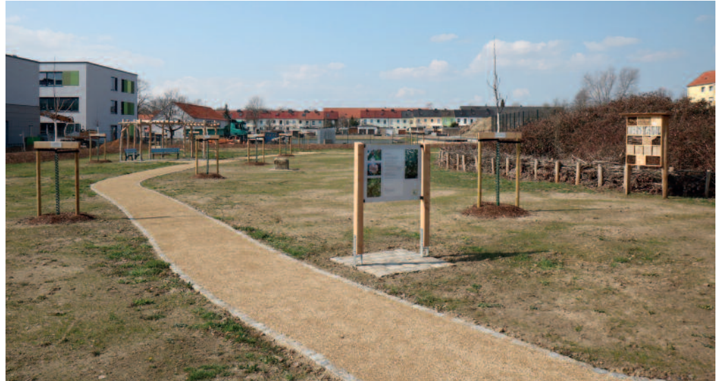
Aus einer Brachfläche ist eine Obstwiese mit echtem Erholungseffekt geworden.

März. Direkt hinter der Schulbaustelle, wo derzeit die Sportanlagen Gestalt annehmen, finden sich unter anderem 25 Obstbäume seltener Sorten wie Altländer Pfannkuchenapfel oder Konstantinopler Apfelquitte, aber auch verschiedene Pflaumen, Kirschen und Birnenarten. Optisch wird das Gelände vom Aussichtshügel mit der Benjeshecke beherrscht, aber auch weitere Bäume und zahlreiche Sträucher, elf Bänke und sogar anregende Gedichte auf drei Tafeln sind zur Entspannung für alle Generationen gedacht, eines davon stammt von Riesas Autorin