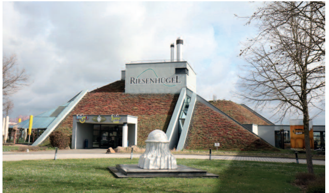
Vom Gastronomie-Tempel wurde der Riesenhügel vorläufig zum Corona-Testzentrum.